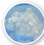
FM-8oKE-HCN Ijssoort: Nugget