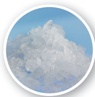
FM-8oKE-HC Ijssoort: Schilfer ijs